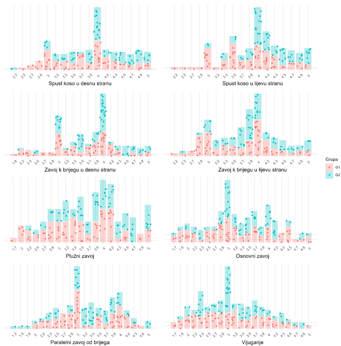
Slika 2. Distribucija ispitanika s obzirom na dobivenu ocjenu u svim promatranim varijablama