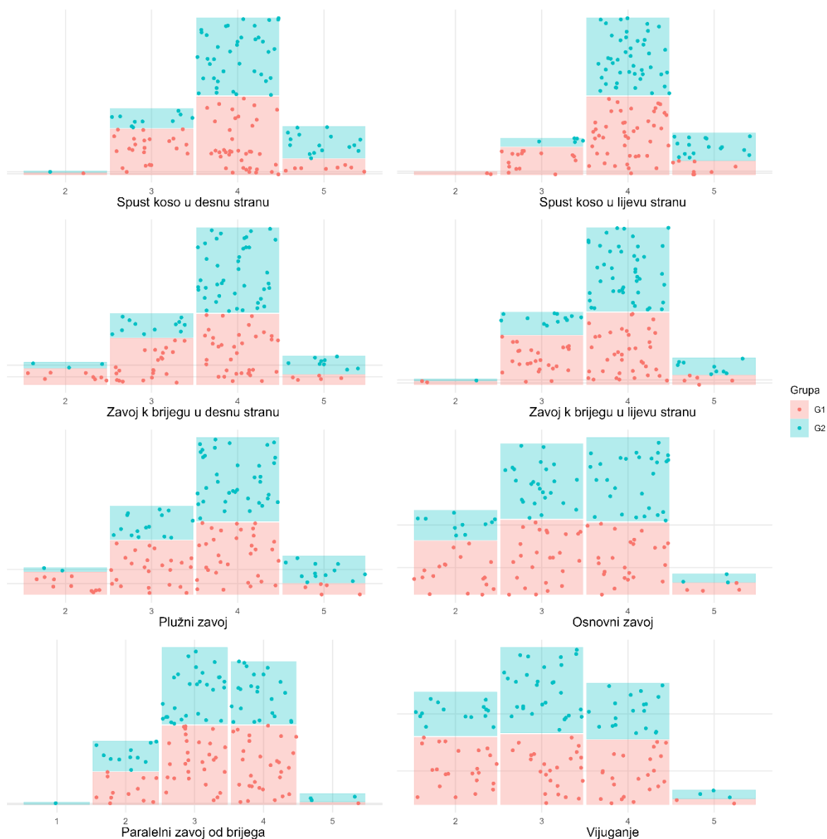
Slika 1. Distribucija frekvencija ocjena za obje grupe u svim promatranim varijablama

Nadalje, slika 2. prikazuje distribuciju ispitanika pripadnika različitih grupa uzimajući u obzir dobivenu ocjenu u svim promatranim varijablama, gdje su ocjene prikazane kao kontinuirana varijabla zaokružena na jedno decimalno mjesto.