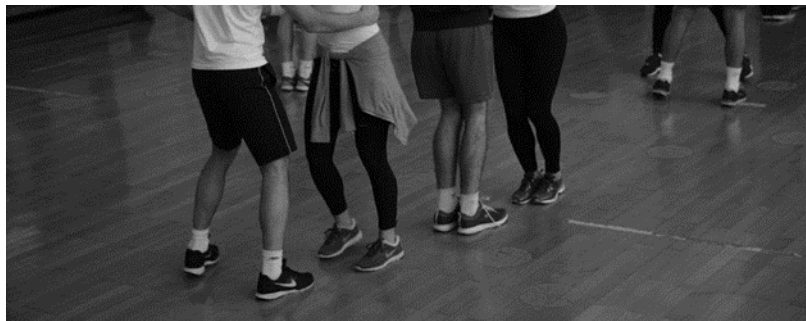
Slika 4. Pravilno izvođenje plesnog koraka*

*ako ste autor fotografije nije potrebno navoditi podatke